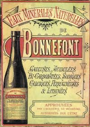
Étiquette de bouteille eau commercialisée jusqu'en 1914