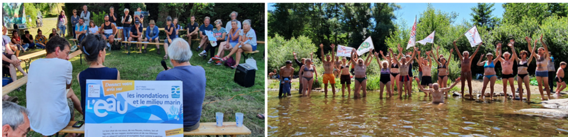
Un débat sur l'avenir de l'eau / Big Jump en musique au Chambon