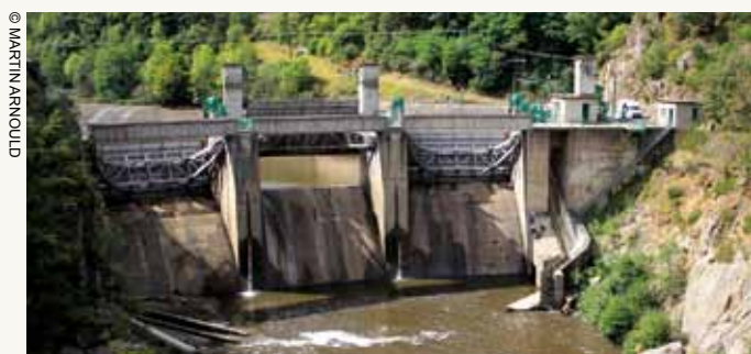
Projet d'effacement du barrage de Poutès sur l'Allier

Il existe bien des alternatives aux grands barrages , créatrices d'emplois, permettant de redéployer les services écologiques des écosystèmes en général, des rivières en particulier, ouvrant le champ de la restauration de la biodiversité 31 , donnant des espoirs concrets de réconciliation des hommes avec leurs fleuves. Le département de la Loire resterait à l'écart de cette tendance forte ?