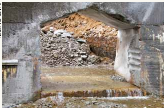
Le barrage des Plats, percé à la base en 2006

La volonté soutenue des élus locaux du Syndicat des Barrages d'engager une telle dépense est-elle raisonnable, dans un contexte contraint pour les finances publiques, avec une conscience grandissante de la nécessaire solidarité et mutualisation des ressources en eau, inscrite dans le IX e programme de l'Agence de l'Eau Loire Bretagne ? Le projet de nouveau barrage a-t-il un sens, quand diverses études déjà effectuées, comme celle de l'Asca 11 en 2008 montrent que « les besoins en eau dans un bassin stéphanois où la dynamique démographique est faible ne posent pas de problème majeur » ? Le projet est-il adapté quand, sur le bassin proche du Gier, sur le versant rhodanien du département, le percement et la mise à la retraite du grand barrage du Pinay 12 , également pour des raisons de sécurité, n'a pas déséquilibré l'approvisionnement en eau de St-Chamond ? La mise sous tuyaux de la Semène est-elle responsable quand les scientifiques, de plus en plus relayés par les politiques publiques, nous sensibilisent, voire nous alertent sur l'impératif de conservation de la biodiversité et sur l'intérêt des services écologiques rendus par les écosystèmes en bon état de fonctionnement ?