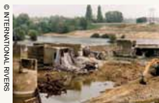
Enlèvement du barrage de Maisons-Rouges, confluence Vienne-Creuse, 1998.