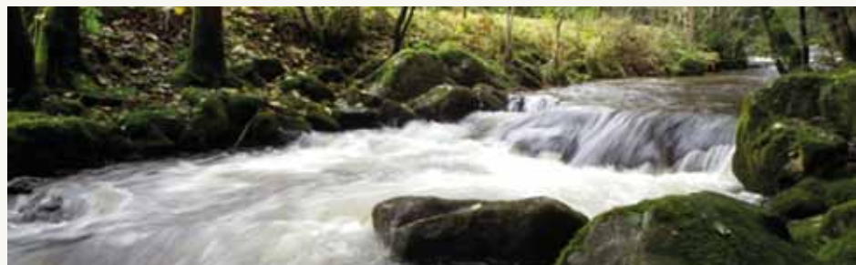
La rivière Semène

Il est temps de sortir de telles pratiques, aussi décevantes sur le plan de la démocratie locale qu'en termes de prise en compte de l'impératif de protection et de restauration des milieux aquatiques d'eaux courantes, dans la Loire comme ailleurs. Nous développons, dans ce court texte, quelques arguments pour signifier l'opposition entière du WWF-France et de son programme « Rivières vivantes » au projet de reconstruction du barrage des Plats. Il y a des alternatives, des investissements plus judicieux à réaliser. Mettons-les en place.