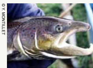
Saumon atlantique (Salmo salar)