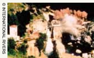
Démolition du barrage de St-Étienne-du-Vigan sur le Haut-Allier, 1998.