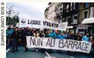
Le Puy-en-Velay, rassemblement européen, 1er mai 1989. 14 000 personnes défilent pour une Loire vivante.