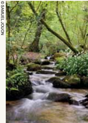
Le Léguer, en Bretagne

Il est à noter que toutes les communes, sans exception, sur lesquelles ont été identifiés des « bassins versants pilotes » ont particulièrement bien accueilli l'idée d'une valorisation de leur territoire à travers une reconnaissance par un « label rivières sauvage ». Les divers élus locaux, rencontrés à plusieurs reprises par les promoteurs du projet ont compris que leur rivière préservée, protégée pouvait être à l'origine d'une valorisation économique durable de leur territoire ( tourisme doux, services écologiques 54 rendus à l'ensemble de la collectivité). Il est possible, sous réserve du travail de présentation qui n'a pas encore pu être fait, et pour cause, que les élus des communes riveraines de la Semène, en commençant par ceux de St-Genest-Malifaux , trouvent intéressante pour leur territoire l'alternative « rivière sauvage ».