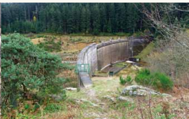
Vue du barrage des Plats