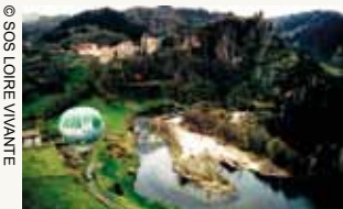
La montgolfière de Loire Vivante sur le site d'Arlempdes, haute vallée de la Loire

Devant le succès actuel dans la mise en œuvre des alternatives aux aménagements alors programmés, face aux économies de centaines de millions d'euros qui ont été permises avec l'abandon des barrages, devant le constat de la fierté qui anime aujourd'hui beaucoup de gestionnaires du Plan Loire Grandeur Nature, un plan pilote à l'échelle internationale , le WWF ne peut que s'étonner de la méthode archaïque adoptée localement par le Syndicat des barrages. Ce dernier ignore le Grenelle de l'Environnement ; il ignore le Plan Loire Grandeur Nature ; il ignore la Convention d'Aarhus ; il ignore la Directive Cadre sur l'Eau ; il élude