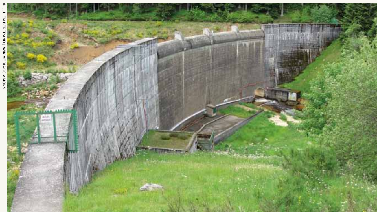
Le barrage des Plats, vide et qui doit le rester.

Le WWF France, Programme «Rivières Vivantes»