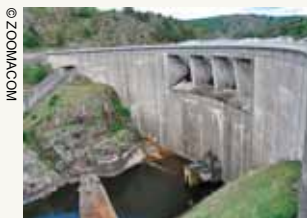
Barrage de Grangent