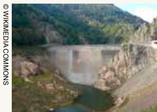
Barrage de Gouffre d'Enfer

Bétonner, inutilement, la Sémène n'est pas donner un bon signal pour notre avenir à toutes et tous. Au contraire : donner un mauvais signal en autorisant cette construction, à la veille du Forum Mondial de l'Eau à Marseille, un « Forum des Solutions » dans lequel notre pays entend donner des conseils, voire des leçons au reste du monde en matière de gestion durable de l'eau serait un contre-sens