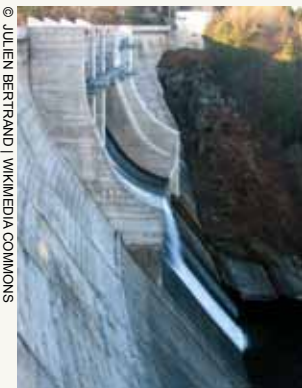
Barrage de Lavalette, Haute-Loire

Or, en proposant, voire en imposant ( le refus de tout dialogue avec la communauté environnementale a été constant depuis 2005 ) ce projet de construction d'un nouveau barrage sur le site des Plats, pour remplacer celui percé en 2006 pour des raisons de sécurité, le Syndicat des barrages 4 , qui regroupe seulement 4 communes de la grande agglomération stéphanoise (Saint-Etienne Métropole) va à rebours de la prise de conscience généralisée sur la nécessité de repenser la gestion de l'eau. En effet, de plus en plus d'acteurs, scientifiques, entreprises, institutions s'efforcent en effet de mettre en place dans notre pays un modèle qualitatif de gestion de la ressource en eau, conscientes qu'il faut sortir d'une gestion purement quantitative de la ressource héritée du modèle de développement économique du siècle passé, ce n'est pas par idéalisme ou opportunisme, mais parce que la réalité, la conscience d'une ressource naturelle fragile et limitée s'est imposée.