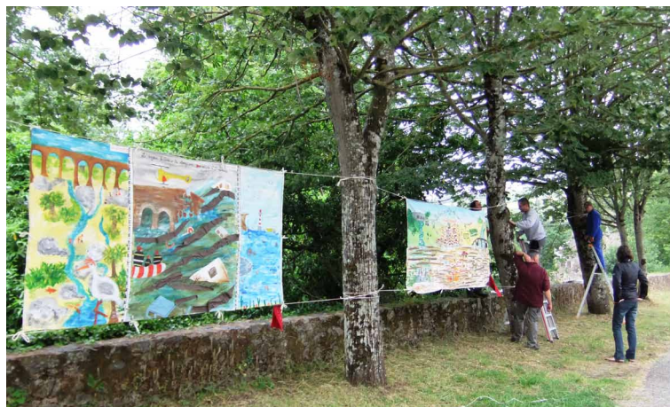
Montage de l'exposition avec l'équipe technique de la Turmelière

Contact : 04.71.05.57.88 rifm@rivernet.org www.rifm.fr