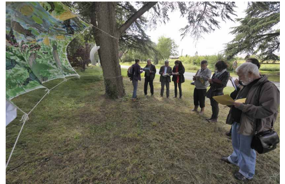
Le jury adulte devant l'une des toiles lauréates