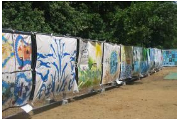
Accrochage des doubles lacets sur grille