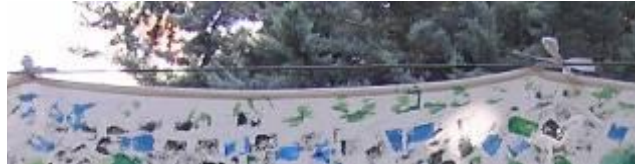
Toile suspendue au câble