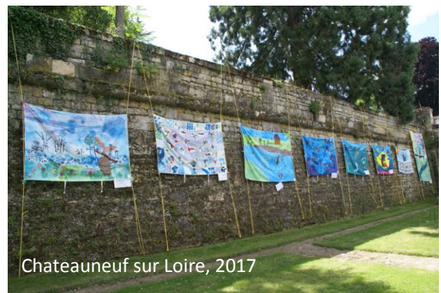
Chateauneuf sur Loire, 2017