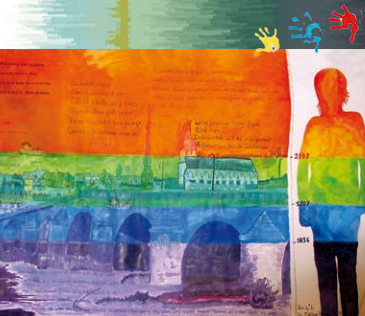
« Crue » Collège Blois-Begon 41000 Blois