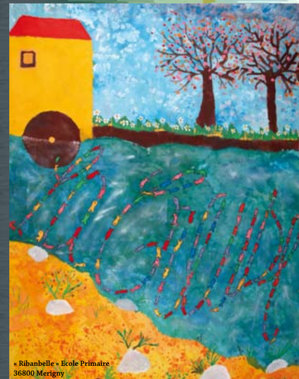
« Ribabelle » Ecole Primaire 36800 Merigny