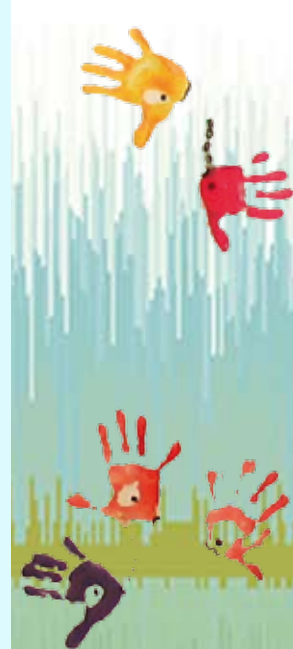
« Gregory River » Gregory Downs Education Facility Australie

More information, on our website: www.ern.org www.sosloirevivante.org