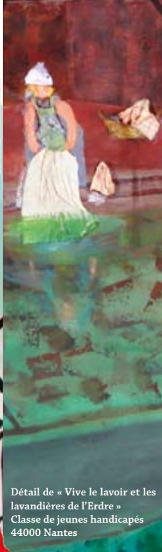
Détail de « Vive le lavoir et les lavandières de l'Erdré » Classe de jeunes handicapés 44000 Nantes

« Loire » Ecole Maternelle 63000 Clermont - Ferrand