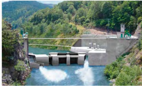
Barrage Poutès (2015) et projet de reconfiguration (dès 2022, après arasement partiel et reconfiguration)

EDF a annoncé le 8 février dernier, lors du comité de suivi Poutès, animé par le Préfet de la Haute Loire, le lancement du chantier en juin 2017.