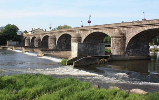
Seuil à Pont-du-Château, avant réaménagement cet automne