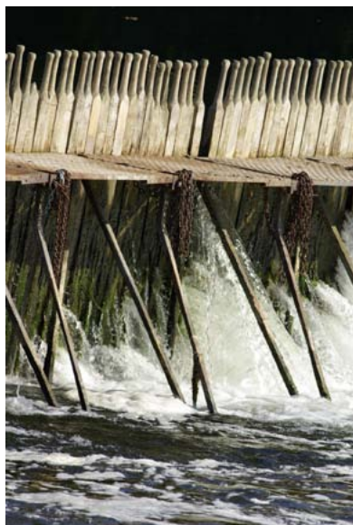
Barrage à aiguilles

De nombreux obstacles entravent aujourd'hui le cours de cette rivière, en particulier les célèbres barrages « à aiguilles ». Malheureusement, rien n'est fait pour y remédier, l'association des « Amis du Cher canalisé » vont même jusqu'à refuser toute intervention en faveur d'une rivière plus naturelle afin de rétablir un chimérique tourisme fluvial sur son cours... Cette situation ne peut plus durer, la réglementation oblige aujourd'hui à agir en faveur de