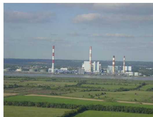
L'estuaire de la Loire