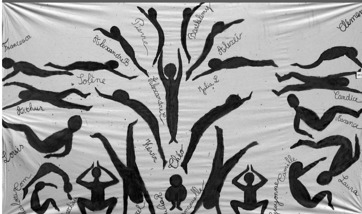
L'eau du Charbonneau - Ecole St Joseph - 44470 Carquefou - CP

Si vous souhaitez participer, contactez-nous !