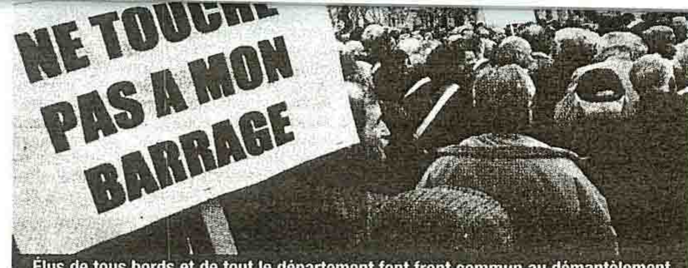
Élus de tous bords et de tout le département font front commun au démantèlement

Détruire le barrage quand l'État mise sur les énergies propres : « hérésie » pour les élus de Haute-Loire, qui rappellent que l'ouvrage produit de l'électricité pour... 50 000 habitants ! » par Guillaume Laurens