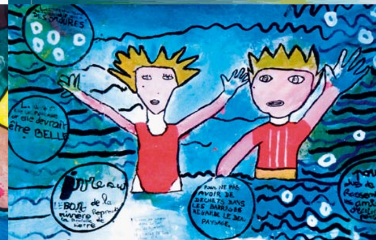
« Baignade dans la rivière » Collège La Chartre sur Loir, 72340 La Chartre sur Loir