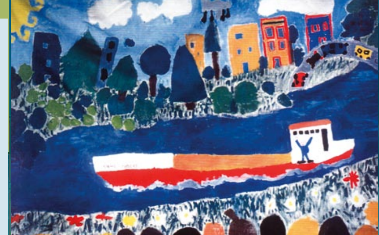
« Le grand Charles et la Loire » Ecole Maternelle Louise Michelle, 44000 Nantes

Then by learning its ecological address (meaning where the child lives on the river basin), the child realises that it belongs to a whole, it is linked to that whole and that all its acts have a consequence on that whole.