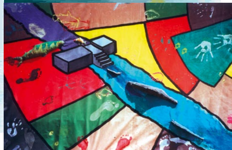
« Aléas l'eau » Collège Jean Rostand, 58260 la Machine