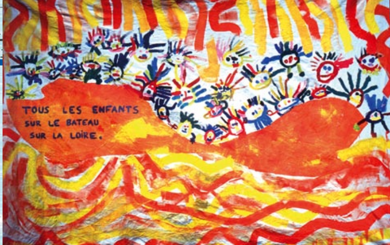
« A dos de poissons » Ecole primaire; Pouzy Mesangy

Im Bewusstsein seiner individuellen Verantwortung im Interesse der Gemeinschaft, entdeckt der Schüler die Auswirkungen des lokalen Handelns und die Rückwirkung auf einem globalen Niveau (Einzugsgebiet der Region, des Landes und der Welt...).