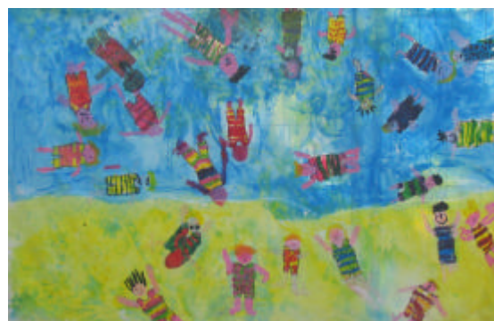
Maillots de bain, l'eau

Les classes lauréates se voient attribuer des lots comprenant des livres, Chaque participant, environ 1200 enfants, a reçu un lot de cartes postal oeuvres lauréates de cette dixième édition.